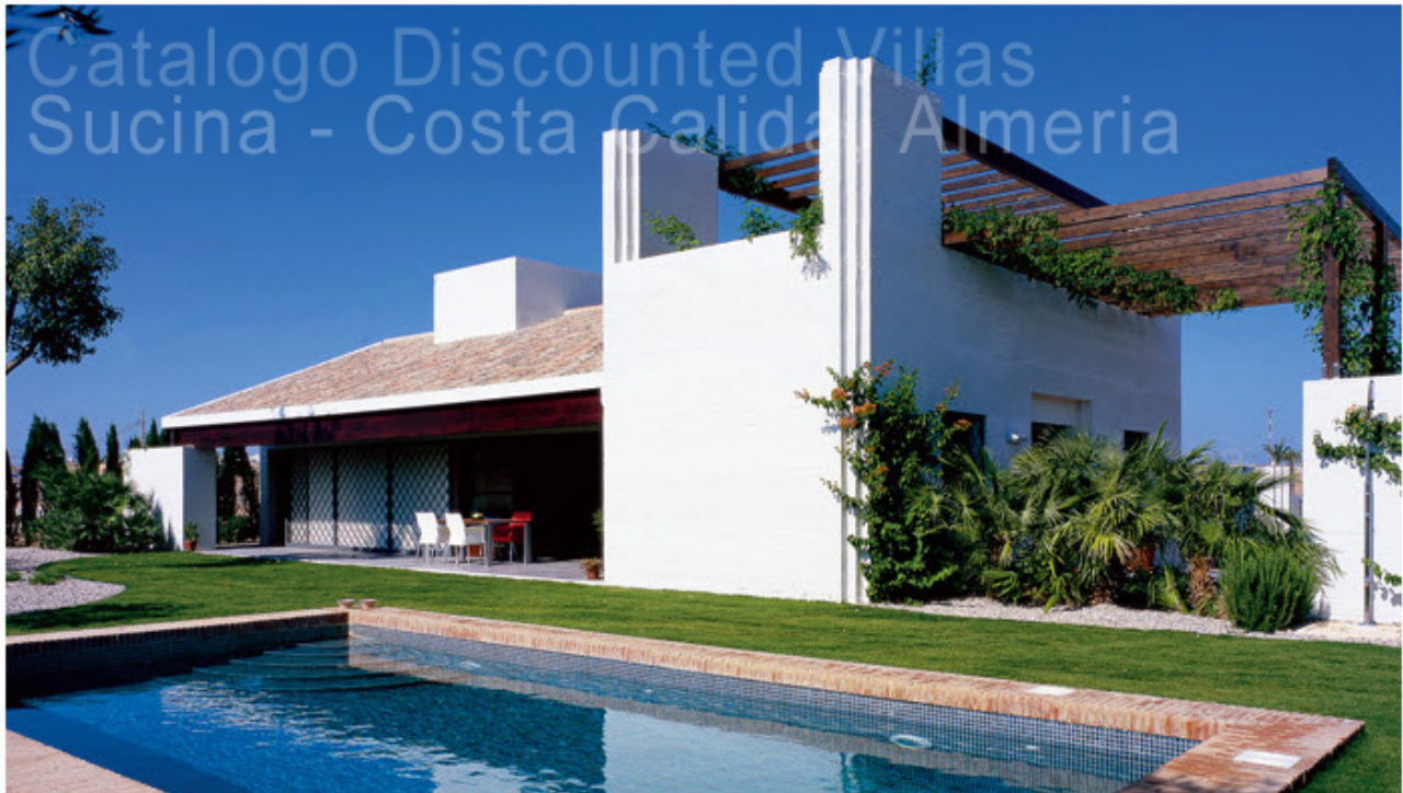
External view with pool